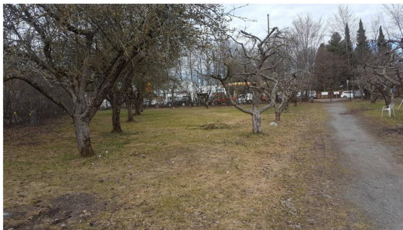
Figur 3: Området sett fra øst

Tomten for Matkultursenterets undervisningsbygg ligger til venstre for alléen og innebærer at hele rekken (6-7) av de store frukttrærne til venstre i bildet må